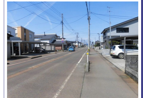
前面消雪道路(国道)