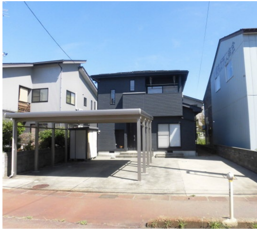
外観(外壁張替完了)