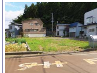
前面消雪道路(北側)