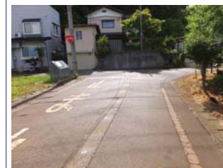
前面消雪道路(北側)